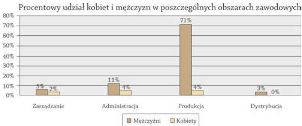
Ryc. 2. Procentowy udział kobiet i mężczyzn w poszczególnych obszarach zawodowych

Sytuacja na rynku edukacji zawodowej i rynku pracy związanym z branżą meblarską powinny ulec zmianie możliwie jak najszybciej. Brak zdecydowanych działań ze strony właściwych urzędów państwowych może jedynie pogłębić kryzys i sprawić, że Polska utraci prym wśród liderów produkcji mebli.